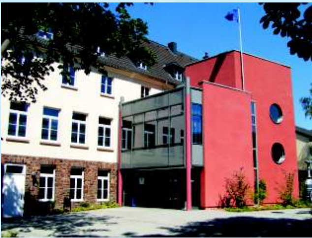
Wasser-Info-Zentrum Eifel (W.I.Z.E.)

Wasser-Info-Zentrum Eifel Karl-H.-Krischer-Platz 1 52396 Heimbach/Eifel Telefon: 0 24 46 / 9 11 99 0-6 (Fax -7) Email: info@wasser-info-zentrum-eifel.de Internet: www.wasser-info-zentrum-eifel.de