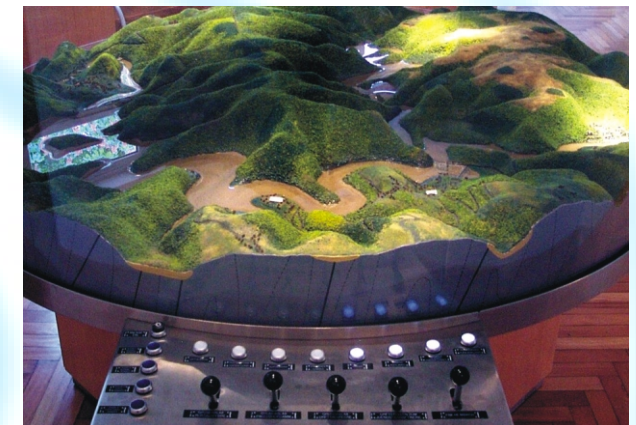
Maquette des barrages