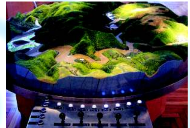
Maquette des barrages