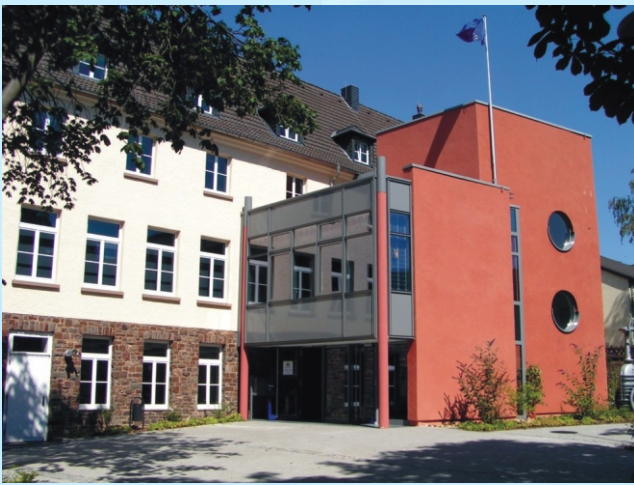
Wasser-Info-Zentrum Eifel (W.I.Z.E.)