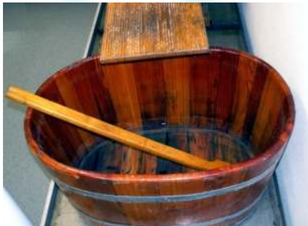
Die Bütt für das Büttenpapier

Die Verbindung von natürlichen Ressourcen, historischer Entwicklung und heutiger Nutzung wird durch die Führung und den anschließenden Workshop den Schülern ab der 3. Klasse in eigenem Erleben und "Selber-Machen" nahe gebracht.