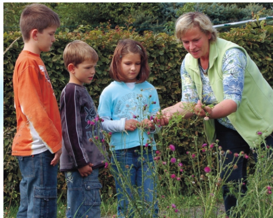
Nur so am Rande ...

Taschenmikroskope und nach Jahrgangsstufen unterschiedlich umfangreiche Arbeitsbögen unterstützen die Schüler beim Entdecken und Verstehen der Pflanzengeheimnisse.